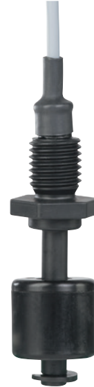
Interruptor de flotador, modelo RLS-7000

WIKA ofrece soluciones de diseño para garantizar que el interruptor de flotador modelo RLS-7000 se adapte perfectamente a la aplicación in situ. Tanto si se trata de una conexión de depósito específica del cliente, como de conexiones eléctricas individualizadas o de diseño: adaptamos el modelo RLS-7000 para fabricantes de equipos originales a los requisitos respectivos. Esto minimiza el trabajo y el costo de instalación y mantenimiento, con máxima seguridad y compatibilidad.