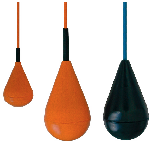
Figure de gauche : type SLS-M2 Figure du centre : type SLS-MS1 Figure de droite : type SLS-MS1-Ex