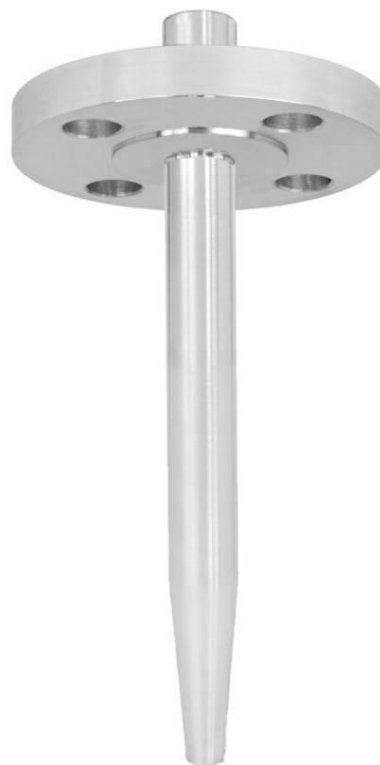
法兰型保护护套 型号 SD400F