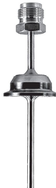
Poço de proteção com conexão aséptica modelo SW200F

Ø 12 x 1,5 mm para sondas de Ø 8 mm com termômetro mecânico