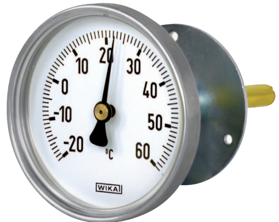
Termometro bimetallico modello A48.10.080