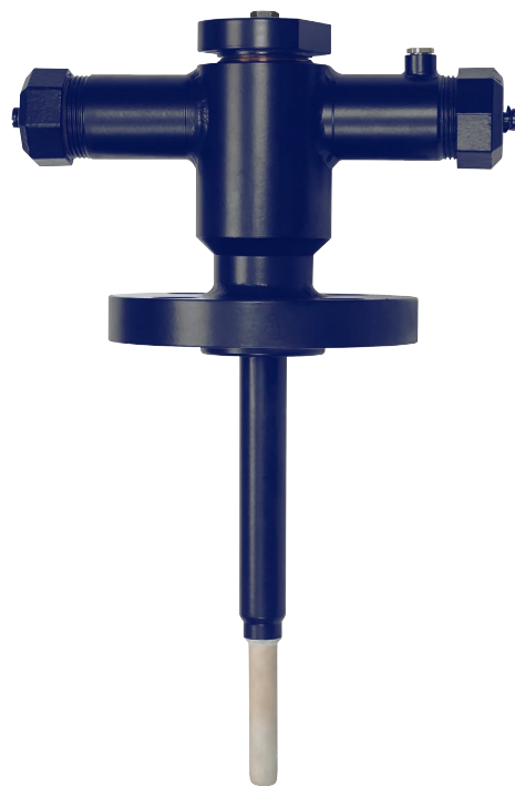
Sensor design safira com tubo de proteção cerâmico externo, modelo TC84