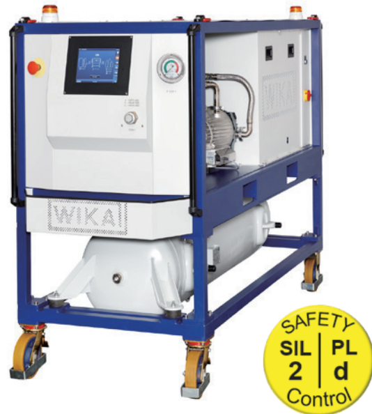
SF 6 工作仪表，带 300 升空罐