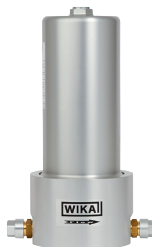
Filtro portátil para SF 6 , modelo GPF-10