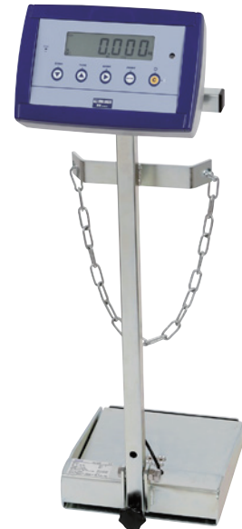
便携式 SF6 气体钢瓶秤 型号 GWS-10