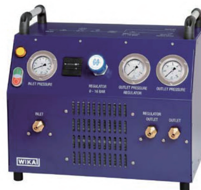
便携式SF 6 气体传输装置，型号GTU-10