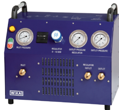
Portables SF 6 -Transfergerät, Typ GTU-10