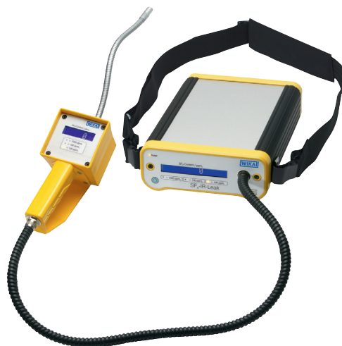
Detektor gazu model GIR-10