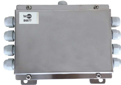
Anschlusskasten, Typ B6577